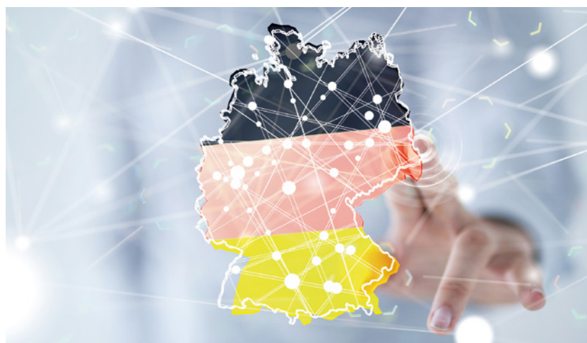
Verkaufsstellen im Bundesgebiet